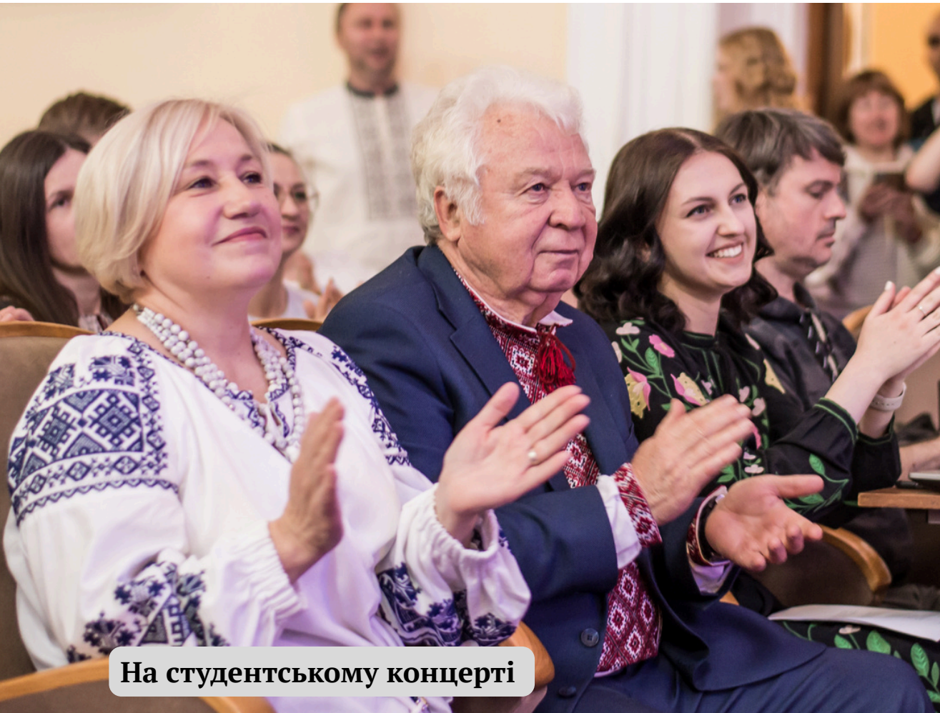
На студентському концерті